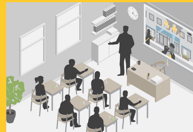
Para treinamento e documentação